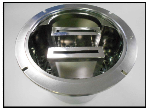
(시험체 설치 모습)